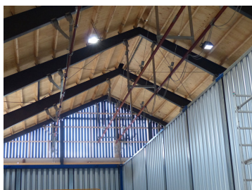
Billede 9. Her ses den nye rammekonstruktion med træåse på tværs og træbeklædning som underlag for pap, som er den afsluttende tagbelægning. Bemærk gavlbeklædningen af brædder som er opsat med en lille afstand for ventilering af kornladen.