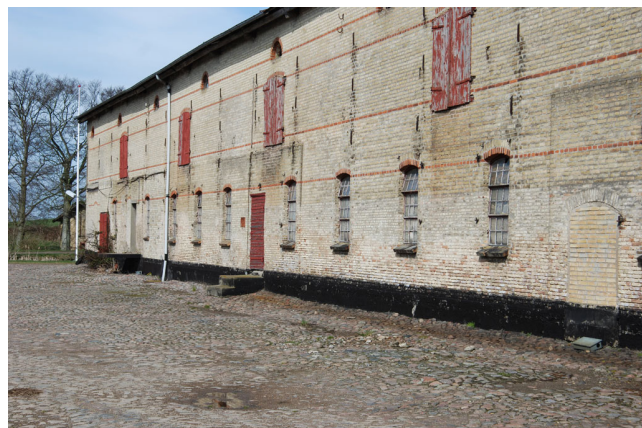
Billede 5. Stald/lade-bygning opført i 1881.

Den storslåede stald/lade-bygning er nu transformeret og genanvendt til et professionelt og fremtidssikret anlæg til korn- og frøbehandling og opbevaring.