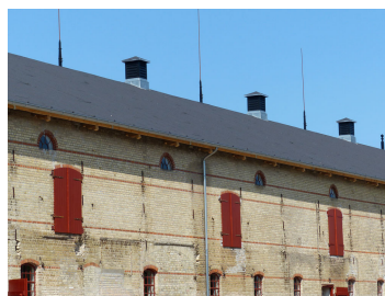
Billede 10. På billedet ses den renoverede langfacade med lemmene, som oprindeligt blev anvendt til indlæsning af stråfoder på det store loftsrum. På rygningen ses rekonstruktionen af de oprindelige aftrækskorstene (tårnsprir) og lynafledere.

Der var åbent hus på "Gammelgaard" i juli 2013 med rigtig mange besøgende. De fik alle en oplevelse af et fornemt eksempel på anden anvendelse af en tiloversbleven landbrugsbygning.