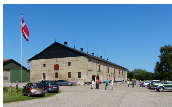
Billede 12. Besøgsdag, juli 2013.