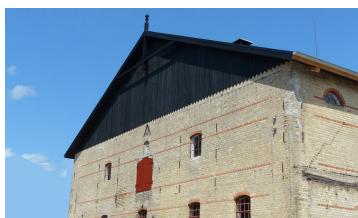
Billede 11. Bygningen set udefra, som den ser ud i dag.

Der var åbent hus på "Gammelgaard" i juli 2013 med rigtig mange besøgende. De fik alle en oplevelse af et fornemt eksempel på anden anvendelse af en tiloversbleven landbrugsbygning.