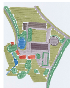
Billede 4. Grov skitse af "Gammelgaard", efter en sanering og fjernelse af uinteressante bygninger.

Der er plads til 25.000 tønder korn i det nyetablerede plansiloanlæg.