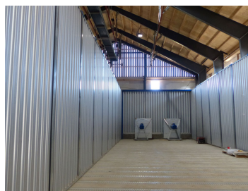
Billede 8. Billedet viser en tom plansilo, som nu i oktober 2013 er fyldt med korn og frø. Gulvet er opbygget af nedgravede kanaler til transport af henholdsvis kold og varm luft. Luften presses op gennem riste (gælleplader) i gulvfladen, som ligger præcist i gulvfladen, så kornet kan hentes ud fra plansiloen med gummiged.