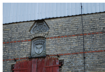
Billede 3. Stald/laden er bygget af Gisbert von Romberg.