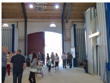
Billede 7. Billedet viser den nye port fremstillet efter den oprindelige, som var todelt med begge døre sidehængte. Lige til højre for porten er der udvendigt bygget et påslag/korngrav til modtagelse af korn og frø. Den indvendige centrale plads er dimensioneret for lastvogne til udtransport.

Den gamle bygning er nu splinterny indvendig, med stålkonstruktioner som har erstattet de oprindelige stolpekonstruktioner af træ.