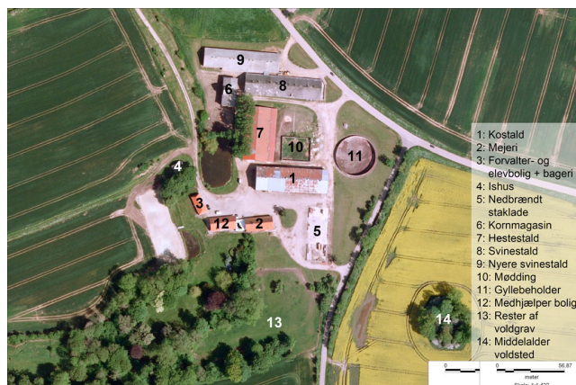
Billede 1. Orthofoto af "Gammelgaard" med bygningsanlæg og nærmeste omgivelser.

"Gammelgaard" er bygget og anlagt på tre plateauer, et forholdsvis smalt overgangslandskab, mellem et storbakket morænelandskab og et lavbundsområde med et vandløb, som ender i et større moseområde.