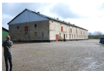
Billede 2. Bygning nr. 1, den gamle stald/lade, opført i 1881 og som den så ud i foråret 2012.

Bygningen har i mange år stået ubrugt hen og med et begyndende forfald til følge.